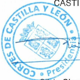
Silvia Clemente Municio

LA PRESIDENTA DE LAS CORTES DE CASTILLA Y LEÓN